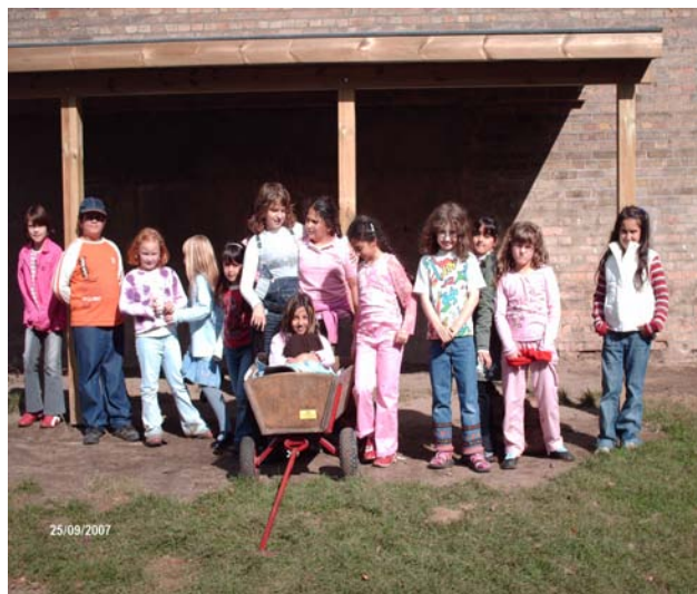
Die Kinder der Hortgruppen nehmen den Unterstand in Besitz

Ein herzliches Dankeschön an alle an diesem Projekt Beteiligten!