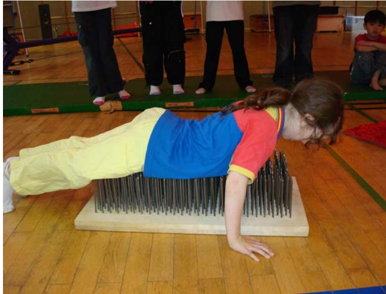
Kinder machen Zirkus