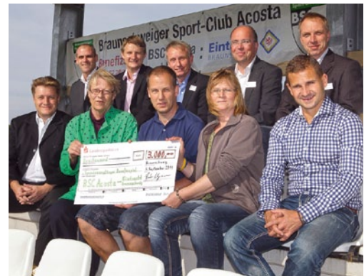
Benefiz-Spiel zwischen Eintracht Braunschweig und BSC Acosta.