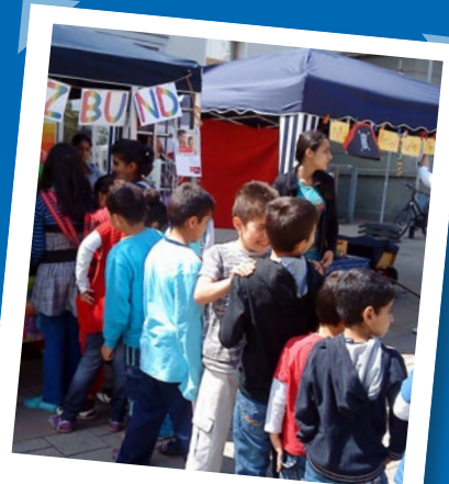
... Frankfurter Platz