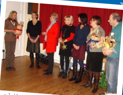
Weihnachtsfeier der Mitarbeiter