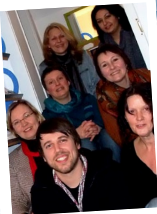
Kursleitung: „Starke Eltern – Starke Kinder“