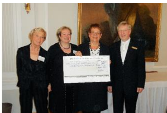
Neubegründung Frauen-Druiden-Loge Brunonia zu Braunschweig e.V.

Wir haben regelmäßige Kontakte zu unseren Kooperationspartnern und zu den Sponsoren gepflegt, die uns eine finanzielle Basis für unsere Projekte verschafft haben. Ohne diese Unterstützung wären einige unserer Hilfs-, Unterstützungs- und Förderprojekte gar nicht möglich gewesen.