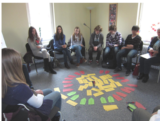
Präventionsworkshop mit Schülern