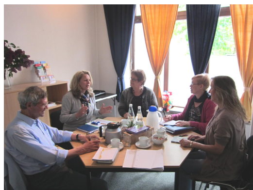
Teamsitzung Pädagogischer Mittagstisch

Für die Zukunft suchen wir für die Übernahme der anfallenden Kosten auch weitere Spender. Ohne sie und ihre Unterstützung ist die Beratungsarbeit nicht zu leisten.