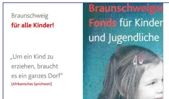
Aktueller Flyer des Braunschweiger Fonds

Der vom Beirat verwaltete Braunschweiger Fonds für Kinder und Jugendliche, der bedürftigen Kindern und Jugendlichen bessere Chancen ermöglichen und materielle Benachteiligungen ausgleichen oder verringern soll, wird aus Spenden gespeist. Er ermöglicht ein Mittagessen in der Schule für alle Kinder in Braunschweig, fördert die soziale und kulturelle Teilhabe der bedürftigen Kinder und ermöglicht Einzelfallhilfen.