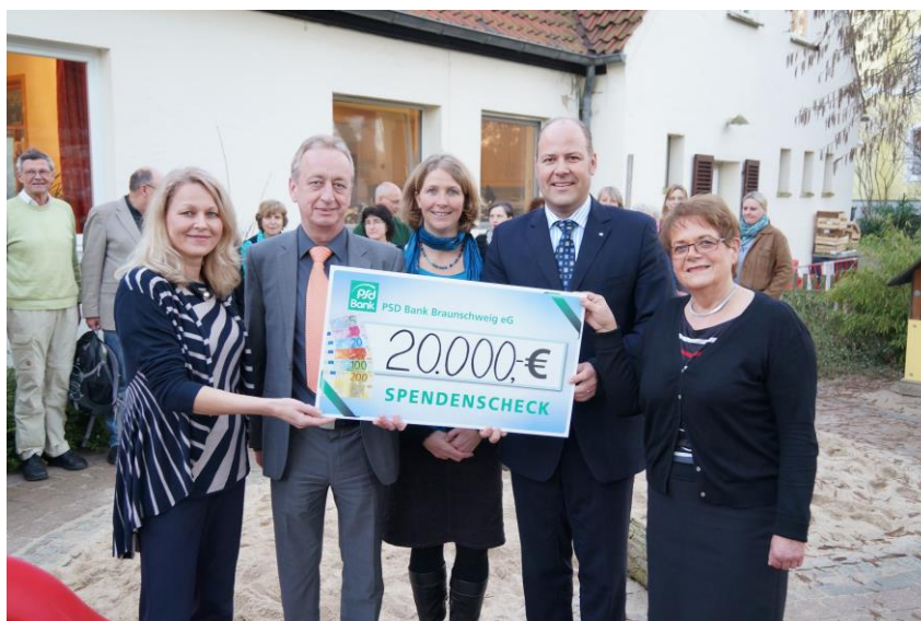
Ein weiteres Jahr Projekt Familienpaten